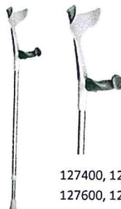
127400, 127450, 127600, 127650