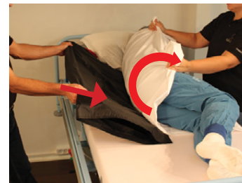
3B) Mens den ene hjælper holder brugeren i sideleje, placerer den anden hjælper Master BOARD Multi fra hovedet og nedefter til hofteparti. Vær opmærksom på at boardet dækker helt op til brugerens isse, da hovedet ellers vil blive voldsomt roteret under overflytningen.