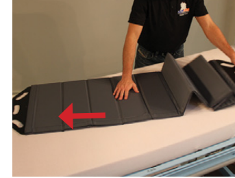
1C) Master Board Multi Large foldes ud