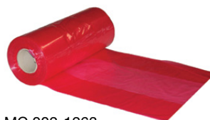
MC 002-1263 Junior/Medium Rød