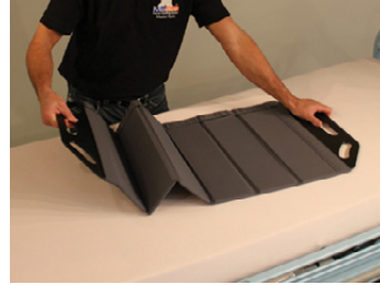
1A) Master BOARD Multi Medium foldes ud.