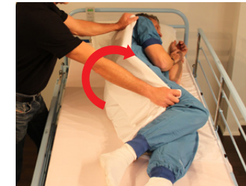
2D) Hvis muligt anvend gerne et lagen til vendingen.