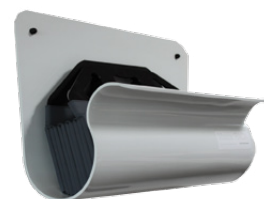
MC 002-1284 Master RACK Folie Holder