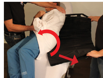
7B) Den ene hjælper ruller nu brugerens vægt over til siden, mens den anden tager fat i de nederste håndtag på Master BOARD Multi. Derved trækkes det meget let væk under brugeren.