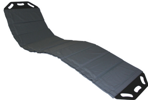
Master BOARD Multi Large