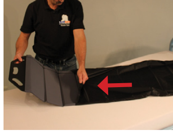
2A) Det vedlagte cover af nylon føres over Master BOARD Multi Medium.