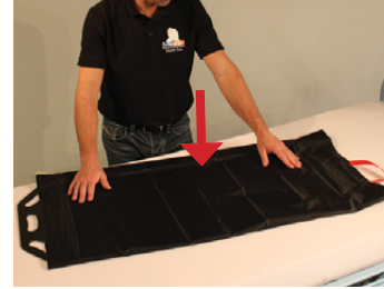
3A) Master BOARD Multi Medium er nu klar til brug.