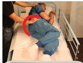
1B) Vend brugeren om til den ønskede side.