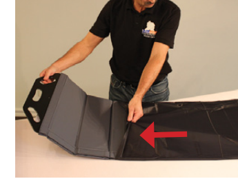
2C) Det vedlagte cover af nylon føres over Master BOARD Multi Large.