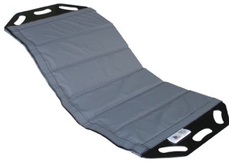
Master BOARD Mutli Medium