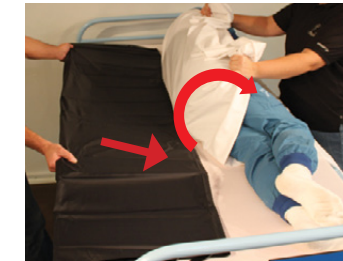
3D) Mens den ene hjælper holder bruger i sideleje placerer den anden hjælper Master BOARD multi, således at det dækker fra hoved og nedefter ved brugerens hofte- og benparti.