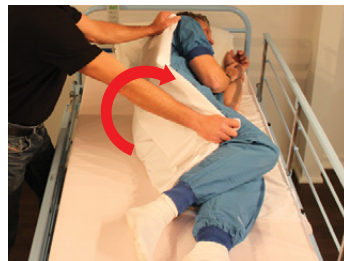
2B) Hvis det er muligt anvend gerne et lagen til vending.