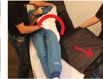
7D) Den ene hjælper ruller nu brugerens vægt over til siden, mens den anden tager fat i de nederste håndtag på Master BOARD Multi. Derved trækkes det meget let væk under brugeren.