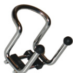
MC 002-1282 Master RACK Vægophæng