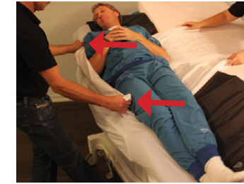
6D) Samtidig trækker hjælper på modsatte side i lagenet ved skulder- og hofteparti. Overflytning på Master BOARD Multi påbegyndes. Brugeren flyttes derved meget let over på det nye leje, da Master BOARD Multi ruller med brugeren.