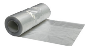
MC 002-1262 Junior/Medium Klar