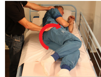
1D) Vend bruger om til den ønskede side.