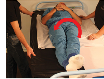
4D) Brugeren rulles nu tilbage og ned på Master BOARD Multi. Sørg for at hoved og det ene eller begge ben er oppe på Master BOARD Multi.