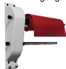
MC 002-1280 Master RACK Vægstativ