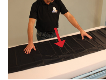
3C) Master BOARD er nu klar til brug.