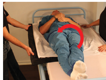
4B) Brugeren rulles nu tilbage og ned på Master BOARD Multi, således det dækker øverste halvdel af brugerens krop.